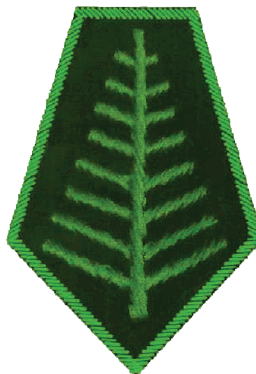
dystynkcje na poziomie koła łowieckiego