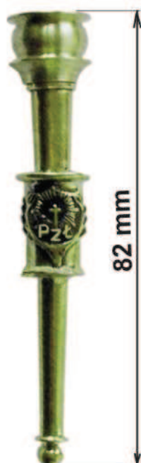
metalowe zakończenie sznura w kolorze srebrnym