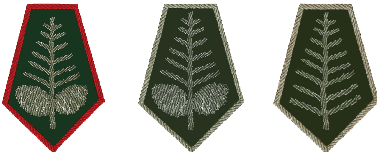
dystynkcje na poziomie okręgowym