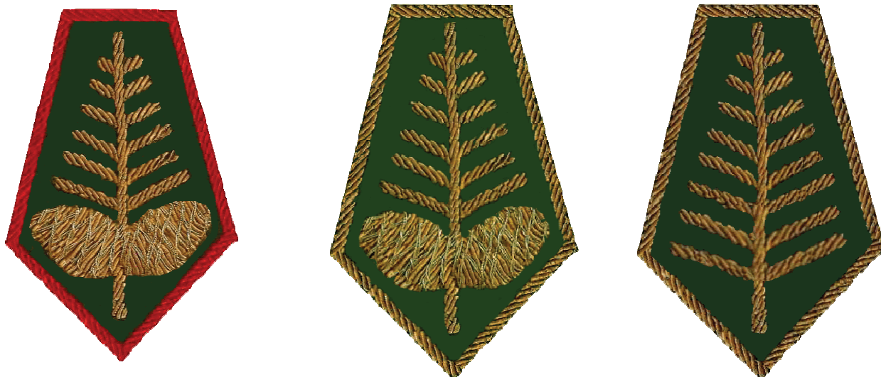
dystynkcje na poziomie centralnym

5. Po wygaśnięciu pełnienia funkcji prawo noszenia dystynkcji pozostaje. Dystynkcja różni się wówczas od dotychczasowej brakiem obszycia obrzeża. Nie dotyczy to Prezesa NRŁ i Łowczego Krajowego, którzy zachowują noszoną dystynkcję dożywotnio.