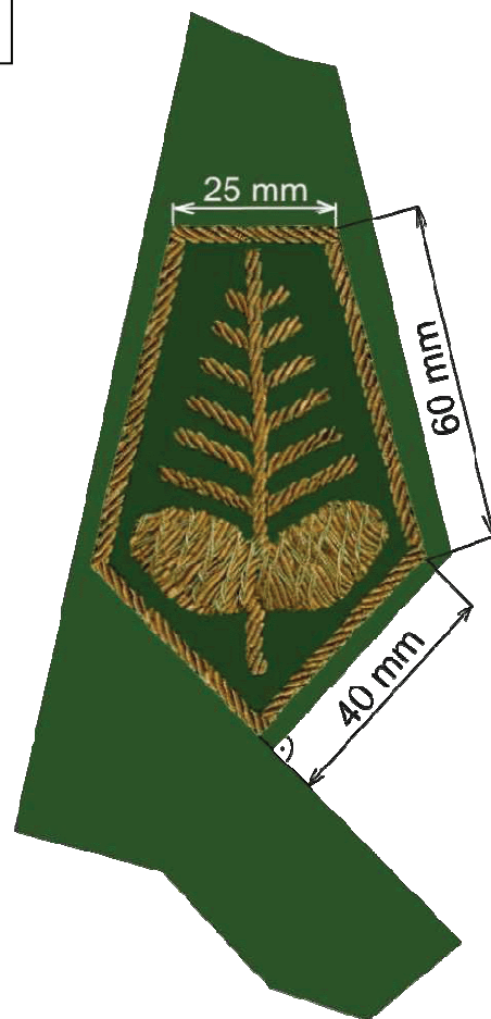
rozmieszczenie i wymiary dystynkcji na kołnierzu marynarki